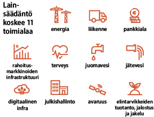
Kuva 1: CER-toimialat

Valvovat viranomaiset valvovat kriittisille toimijoille määrättyjen velvoitteiden noudattamista ja tukevat riskienhallinnan kehittämistä. Lisäksi valvovat viranomaiset ja Finanssivalvonta kehittävät ja tukevat kriittisten toimijoiden häiriönsietokykyä yhteistyössä toimialaministeriöiden ja Huoltovarmuuskeskuksen kanssa.