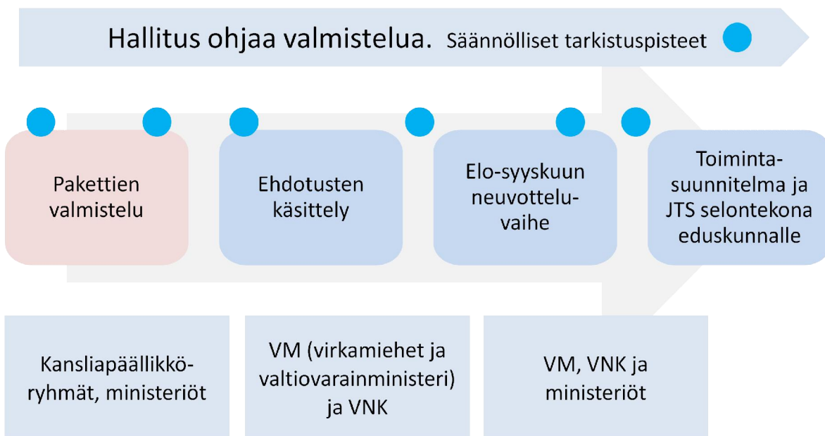
Kuvio 1. Kesän 2015 toimintasuunnitelman ja JTS:n valmisteluprosessi

Toimintasuunnitelman politiikkapakettien valmistelu ehdotetaan toteutettavaksi kesällä 2015 poikkihallinnollisissa kansliapäällikköryhmissä (pakettiryhmissä), jotka toimivat hallituksen ohjauksessa. Hallitus sopii, minkä ministeriön kansliapäällikön johdolla kukin politiikkapaketti valmistellaan ja minkä ministeriöiden kansliapäälliköt osallistuvat kunkin paketin valmisteluun. Politiikkapaketteja valmistelevat kansliapäällikköryhmät asetetaan joko hallituksen toisessa järjestäytymisistunnossa (toinen yleisistunto), tai VNK (pääministeri) asettaa ryhmät.