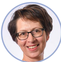
Sari Essayah Kristillisdemokraattinen eduskuntaryhmä