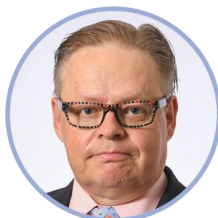
Juhana Vartiainen Kokoomuksen eduskuntaryhmä