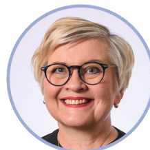
Anu Vehviläinen Keskustan eduskuntaryhmä