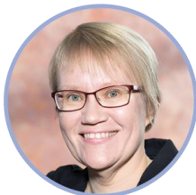
Milja Tiainen sosiaali- ja terveysministeriö